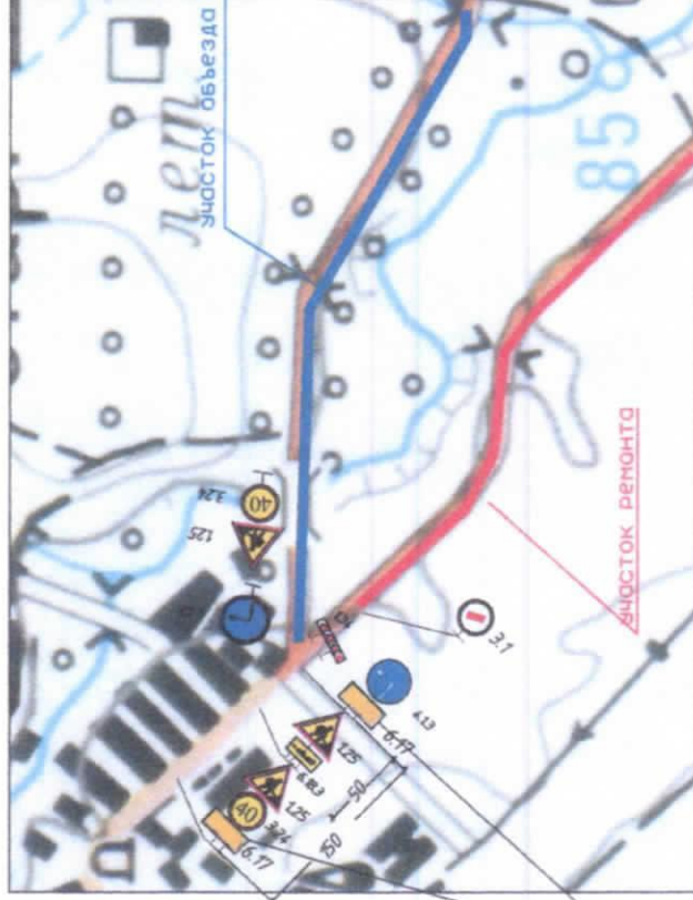
Взвешивание на желтом фоне согласно дополнений п 5.1.8 ГОСТ 52.219-2004